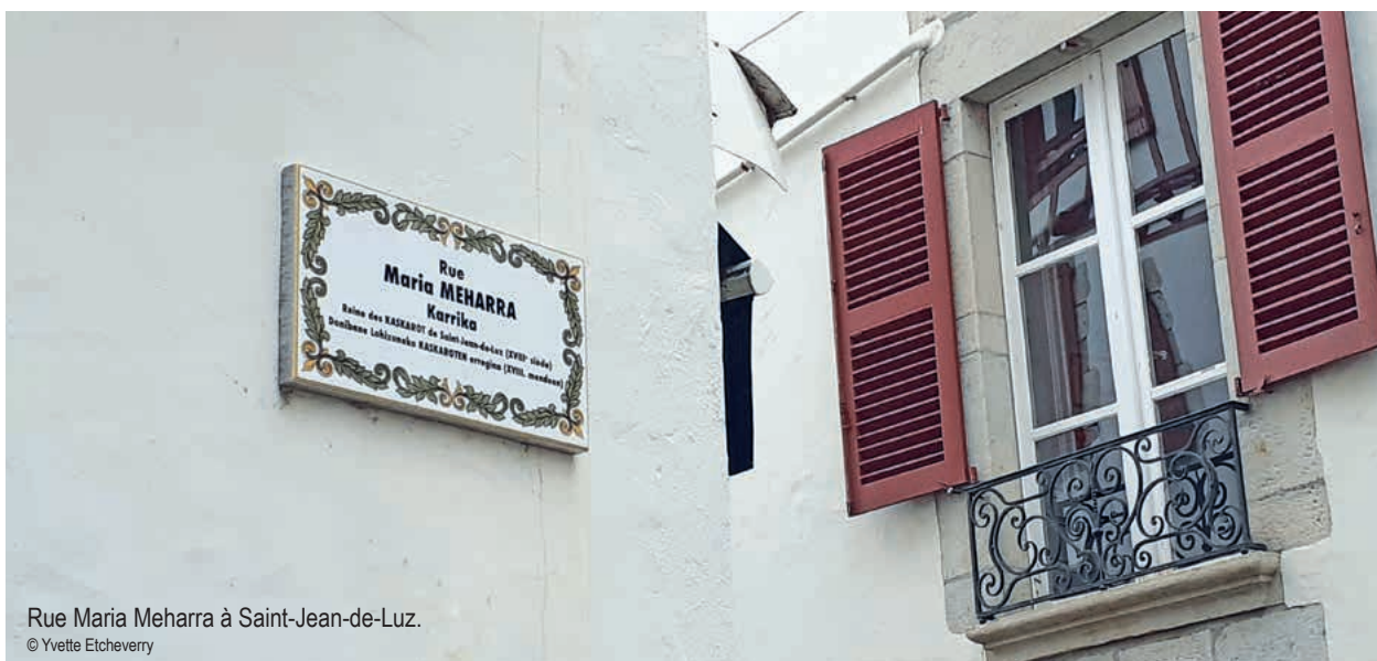
Rue Maria Meharrà à Saint-Jean-de-Luz.

C'est assister à un véritable cours d'histoire d'une cité que d'examiner la dénomination des rues, places et boulevards. À titre d'illustration, la toponymie publique de Saint-Jean-de-Luz offre un bon exemple.