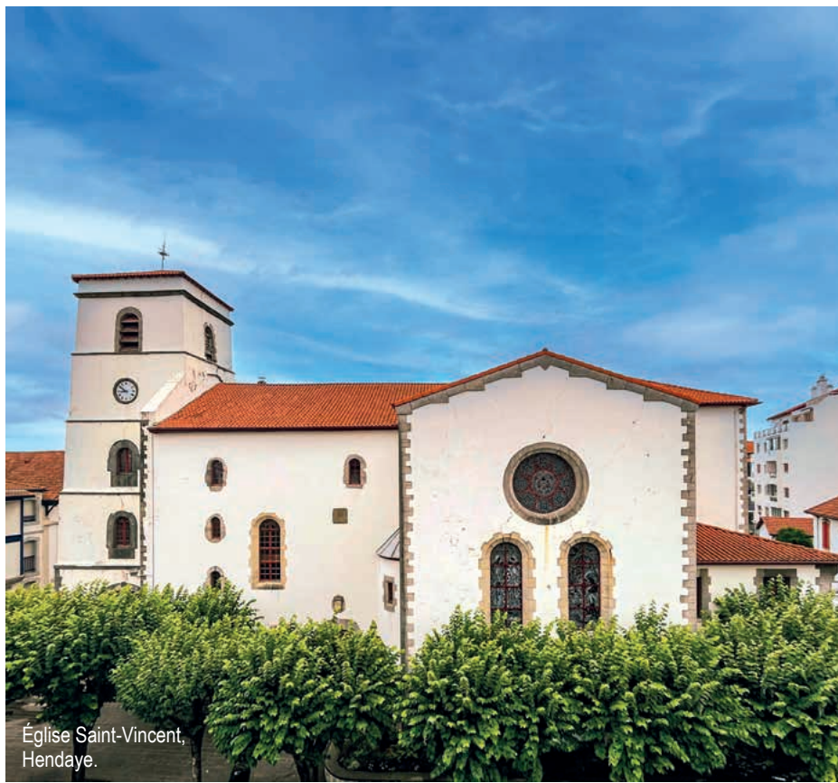
Église Saint-Vincent, Hendaye.

Grâce à la sélection de cette 7 e édition du Loto du Patrimoine, l'église Saint-Vincent bénéficiera d'un soutien financier pour sa restauration. Les travaux prévus incluent le remplacement des enduits ciments par des enduits à la chaux, la restauration des peintures rouge basque sur les menuiseries, et la réparation des