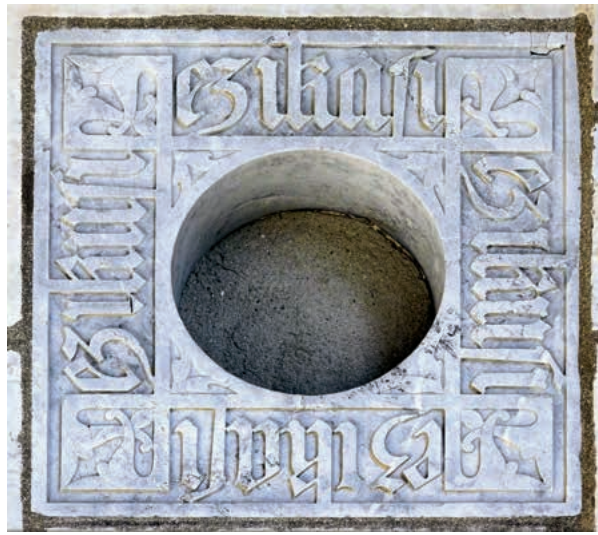
Ez ikusi, ez ikasi ! - Porche de l'entrée du château Abbadia, Hendaye.

« E z ikusi, ez ikasi ! » Pas vu, pas appris ! Par cette sentence lapidaire, Antoine d'Abbadie d'Arrast reconnaît, au pas de la porte de sa demeure hendayaise, qu'il a échoué à apprendre, faute de pouvoir voir. L'expérience du savant d'hier reste celle des chercheurs d'aujourd'hui. Les moyens de l'apprentissage mènent l'homme à l'acquisition d'un savoir, d'un savoir-faire, d'un faire-savoir et même d'un savoir-être. Vous allez parcourir les articles de ce Denak Argian – Tous dans la lumière en apprenant beaucoup de choses. Tant mieux ! Vous seront-elles utiles ? On en reparlera... L'équipe de rédaction tient à remercier ceux qui ont répondu aux questions qui leur ont été posées pour réaliser un dossier sous ce titre insolent « Apprendre : pourquoi ? » Car, de l'artiste à l'agriculteur, en passant par le directeur de collège et le prêtre âgé, tous nous apprennent qu'il faut du temps pour constituer l'être dans son essence et sa profondeur. Selon André Gide, « Le meilleur moyen pour apprendre à se connaître, c'est de chercher à comprendre autrui ». C'est ce qui nous a passionnés. Et vous, ouvrez l'œil !