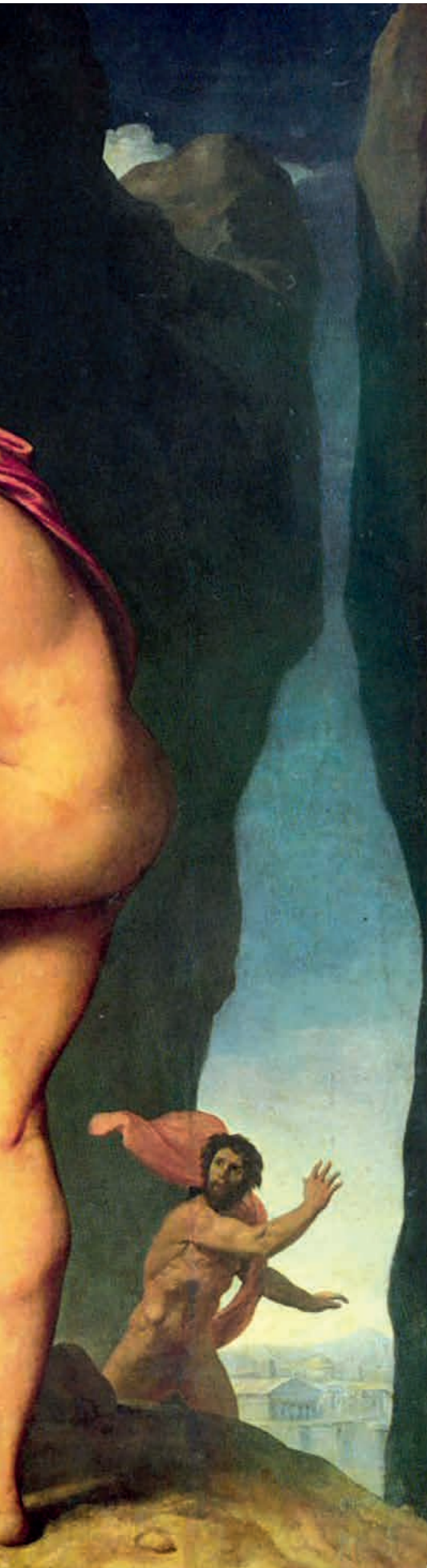
Œdipe et le Sphinx par Ingres.

est « l'homme » qui, enfant, marche à quatre pattes, adulte, se tient debout seul, et âgé, s'appuie sur un bâton.